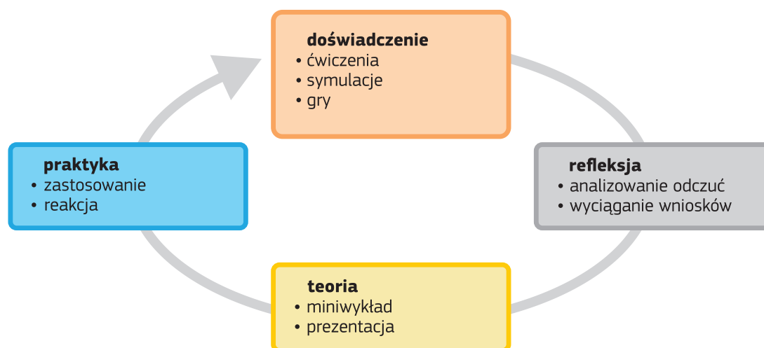
Ryc. 1. Cykl Davida A. Kolba.

Każdy warsztat można zaprojektować jako proces służący pogłębianiu świadomości i poszerzaniu wiedzy, nauce lub doskonaleniu umiejętności, zmianie postaw osób uczestniczących. Warto zwrócić uwagę nauczycielom, że przed rozpoczęciem warsztatu powinni zastanowić się i podjąć decyzję, czy warsztat będzie działaniem jednorazowym, punktowym (i wtedy należy postawić przed sobą cele związane na przykład z pogłębieniem wiedzy na wybrany temat lub rozwijaniem jakiejś umiejętności, choćby reagowania na przejawy uprzedzeń), czy mamy szansę na regularną pracę z daną grupą. W takiej sytuacji warsztaty będą miały charakter cykliczny, będą dłuższym procesem, dzięki któremu będzie możliwa zmiana postaw (np. w klasie istnieje problem wykluczenia lub hejtu, gorszego traktowania kogoś z grupy).